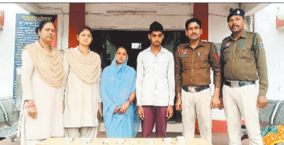
पुलिस गिरफ्त में आरोपी।