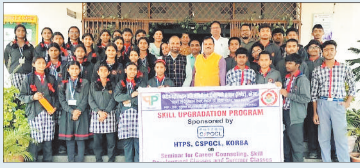
प्रशिक्षकों द्वारा पांच दिवसीय रोजगार मूलक कौशल विकास प्रशिक्षण के तहत प्लास्टिक उत्पाद बनाने वाली मशीनों की कार्यप्रणाली, रखरखाव एवं कंप्यूटर संचालन का प्रशिक्षण दिया गया। इसके साथ ही सिपेट द्वारा युवाओं को आईटीआई प्रशिक्षण की तर्ज पर कन्वेंशनल मशीनिंग और कंप्यूटर न्यूमेरिक कंट्रोल मशीनिंग का प्रशिक्षण दिया गया।