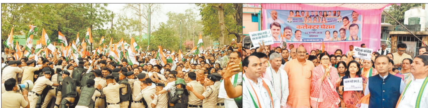
पुलिस के साथ झूमाझटकी करते कांग्रेसी।