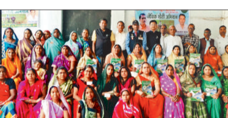
हरिभूमि न्यूज ॥ बहेराडीह

बलौदा क्षेत्र के पांच गांव में किसान स्कूल बहेराडीह द्वारा जैविक खेती अभियान के तहत जागरूकता कार्यक्रम का आयोजन किया गया। इसके साथ ही पशु सखी और जैविक खेती के लाभ व रासायनिक खाद के लाभ व होने वाले नुकसान के बारे में बताया गया।