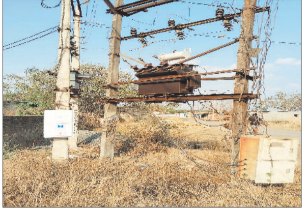
दर्री टांड में बिगड़ा पड़ा ट्रांसफार्मर।