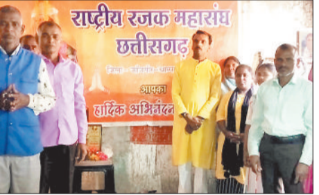
जयंती कार्यक्रम में उपस्थित समाज के लोग।

ग्राम पोड़ी दल्हा में समाज सुधारक संत गाडगे महाराज की 150वीं जयंती श्रद्धा, सम्मान और सामाजिक जागरूकता के संदेश के साथ मनाई गई। कार्यक्रम में बड़ी संख्या में समाजजन उपस्थित होकर उनके बताए मार्ग पर चलने का संकल्प लिया।