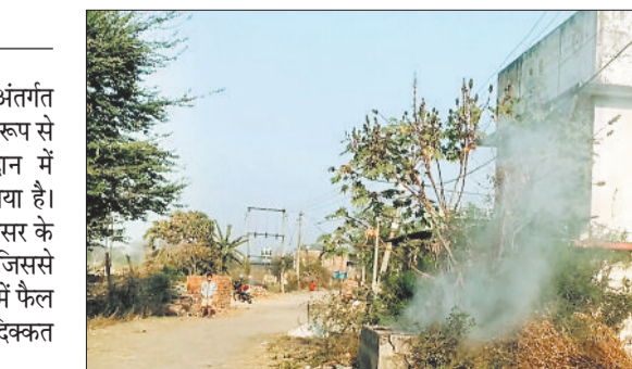
एक्सपायरी दवा के जलाने से निकलता धुआं।

सामुदायिक स्वास्थ्य केंद्र बम्हनीडीह अंतर्गत ग्राम देवरी के उपस्वास्थ्य केंद्र में कथित रूप से एक्सपायरी दवाओं को खुले कूड़ेदान में डालकर जलाने का मामला सामने आया है। ग्रामीणों का आरोप है कि अस्पताल परिसर के समीप दवाओं में आग लगा दी जाती है, जिससे उठने वाला जहरीला धुआं पूरे मोहल्ले में फैल जाता है और लोगों को सांस लेने में दिक्कत होती है।