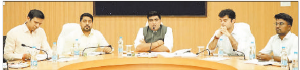
बैठक लेते कलेक्टर व अन्य।

कलेक्टर ने समय-समय की बैठक लेकर विभागीय कामकाजों की समीक्षा की। उन्होंने फ्लैगशिप योजनाओं के क्रियान्वयन में प्रगति लाने के निर्देश दिए और टीएल के लंबित प्रकरणों को निराकरण कर जानकारी प्रस्तुत करने कहा। बैठक में कलेक्टर ने शासकीय उचित मूल्य दुकानों में खाद्यान्न वितरण न होने की शिकायतों को गंभीरता से लेते हुए खाद्य विभाग-नॉन को निर्देशित किया कि राशन दुकानों में भंडारण समय पर होने के साथ हितग्राहियों को खाद्यान्न प्राथमिकता से वितरित हो। कलेक्टर ने सभी एसडीएम को खाद्य निरीक्षकों की बैठक लेकर समीक्षा करने और खाद्यान्न वितरण सुनिश्चित करने के