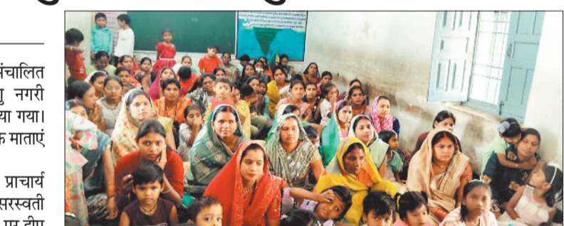
शिशु नगरी कार्यक्रम में उपस्थित महिलाएं।

शबरी देवी शिशु समिति द्वारा संचालित सरस्वती शिशु मंदिर में शिशु नगरी कार्यक्रम का सफल आयोजन किया गया। इस दौरान बड़ी संख्या बच्चे व उनके माताएं बड़ी संख्या में उपस्थित थे।